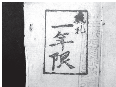
印判 B ①