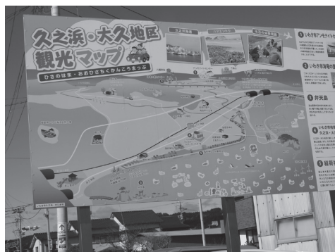
【写真9】 新しい久之浜・大久地区観光マップ