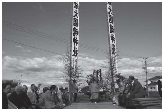
【写真1】 震災直後のいわき市大國魂神社 浜下り神事