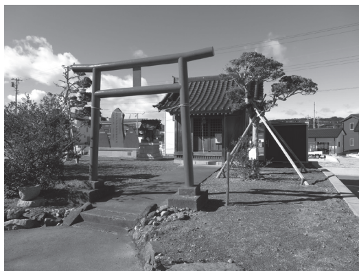
【写真6】 現在の久之浜の稲荷神社