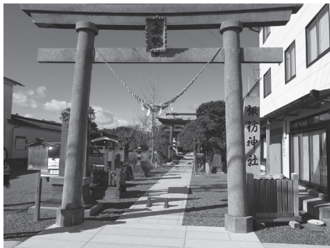
【写真7】 現在の久之浜諏訪神社