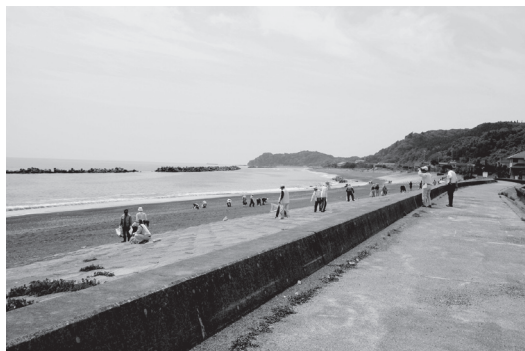
【写真2】 全国から集まった久之浜 清掃ボランティア