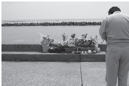
【写真3】 震災直後久之浜防潮堤上に設けられた 供養の献花台