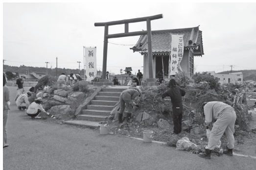
【写真4】 奇跡の社と呼ばれた被災直後の久之浜稲荷神社