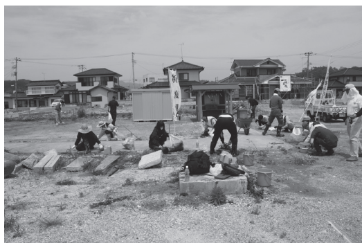
【写真5】 久之浜星廻宮神社跡を清掃するボランティア