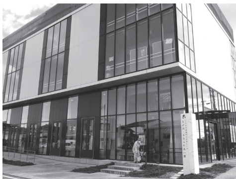
【写真8】 新設された公民館（久之浜・大久ふれあい館）