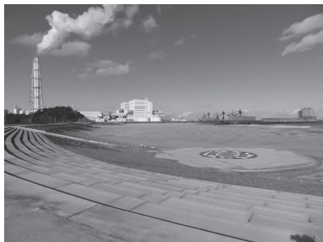
【写真 15】 原町火力発電所北泉海水浴場

このように沿岸部の景観が変わってきております。浜通りを見て分かることは、大量の空地が残っているということです。【写真 15】は原町の火力発電所です。ヘリポートができていますけれども、福島第一原発や第二原発もありますし、火力発電所が岬の所に転々と造られています。そして小名浜などに象徴されますが、四日市のような巨大なコンビナートなどがあります。更に海岸地帯には、見るからに工場立地に使えそうな広大な空き地が残されています。今後どのような活用をされるのか心配されるところでです。 心の復活ということが段々できてきて明るい気持ちになる一方、