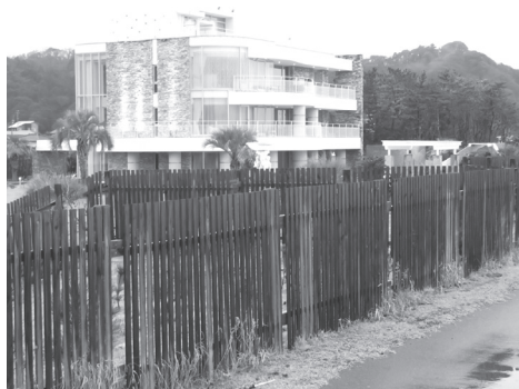
【写真 14】 合磯海岸堤防の緑化