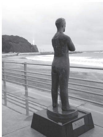
【写真 13】 豊間海岸「海を見る」像