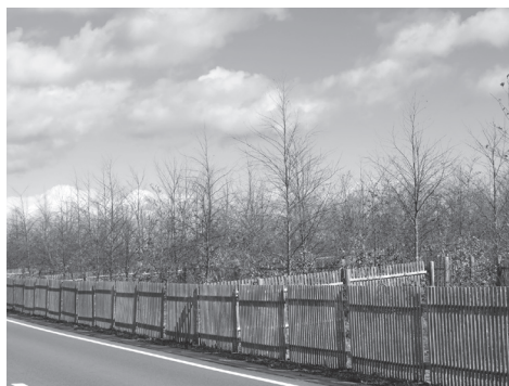
【写真11】 堤防の防災緑地化