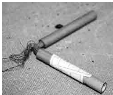
図2. 「なでし」、八丈町歴史民俗資料館蔵

しかし、この方法でははじめに収集した音声とテキストとは異なるものになってしまうため、音声談話資料として整備することはできなくなってしまふ。また、修正テキストを元に音声化を行なえば、当然読み上げ音声になってしまう、自然な音声とはいえなくなる。そこで、打開策として、題材を民話に採り「語り」のスタイルを取り入れ、音声が少しでも自然なものに近づくように工夫したものを作成することとした。例えば方言での会話をテキストに基づいて演じてもらうといかにも不自然なものになってしまうが、物語を語るというスタイルを借りれば、不自然さが軽減される。テキストにできるだけ自然な音声をつけるために「語り」のスタイルを取り入れることで、話者の内省に基づく伝統的な八丈語のテキストと、それに基づいた自然な音声を残すことができると考えたのである。