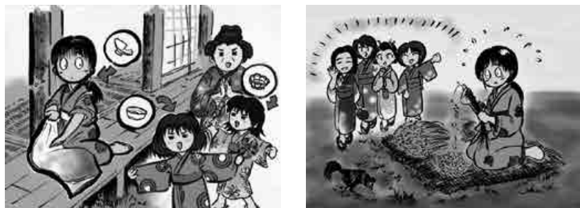
図3. 八丈語紙芝居「民話欠け皿」の一場面

材にとって紙芝居を作成し、映像化する試みも行なっている。絵はイラスト製作を趣味とする方に依頼して作成を始めた（図3）が、2017年度からは研究者としても活動しているイラストレーターと連携して作成を進めることで進捗効率をあげている。